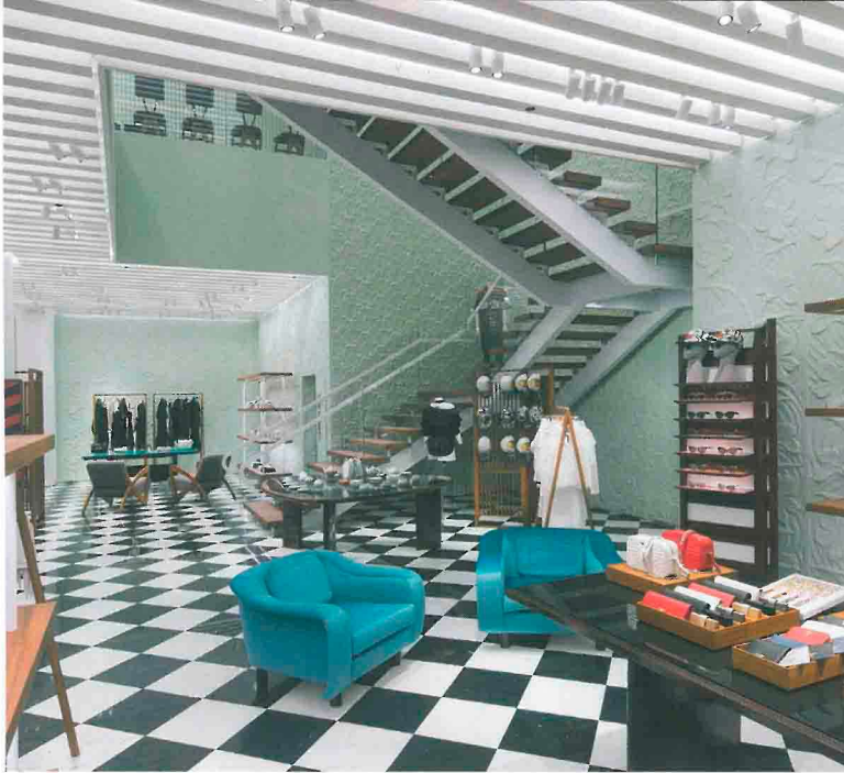
Bild linke Seite: Aufwändige Bodengestaltung mit eingebauter optischer Täuschung Bild oben: Die Möbel sind brasilianische Midcentury-Klassiker Bild rechts: Das Obergeschoss hat dieselbe markante Deckengestaltung