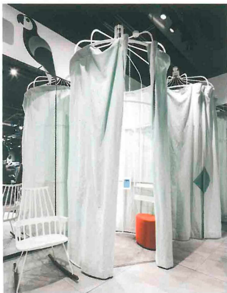
Umkleiden in Form eines Vogelkäfigs in der Kinderabteilung. Darin moderne Technik über iPad