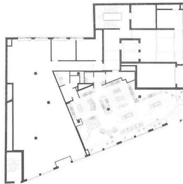
Erdegessch • Ground floor plan