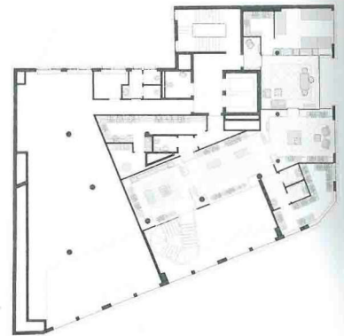
Obergeschoss • Upper floor plan