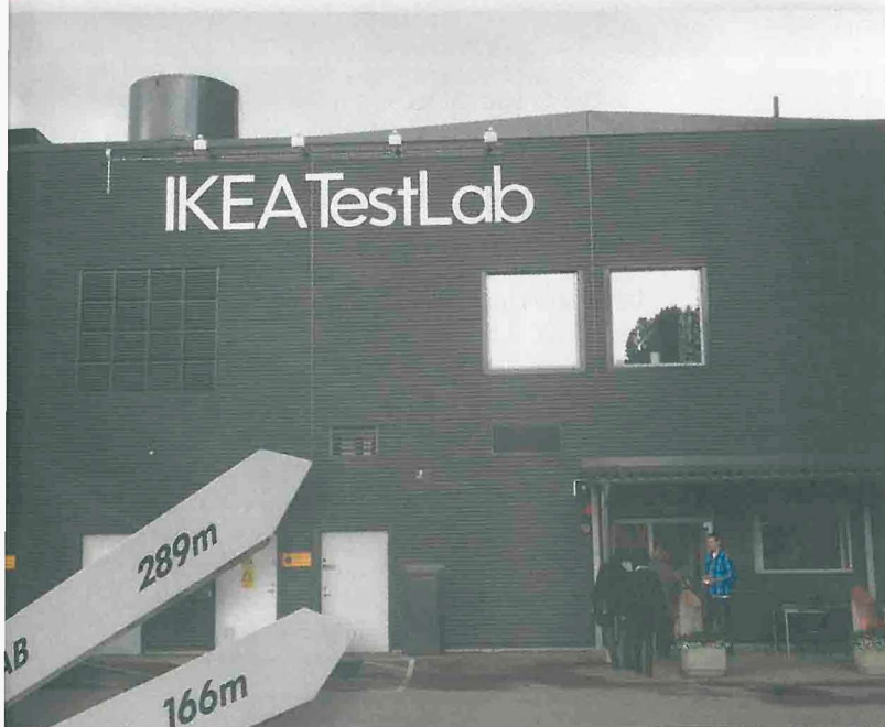
Chez Ikea Communications (ci-dessous), l'une des missions essentielles est la mise au point du catalogue. 20 000 prises de vue annuelles sont ainsi réalisées à Älmhult, dans les immenses studios.