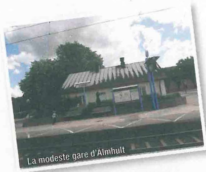
La modeste gare d'Älmhult